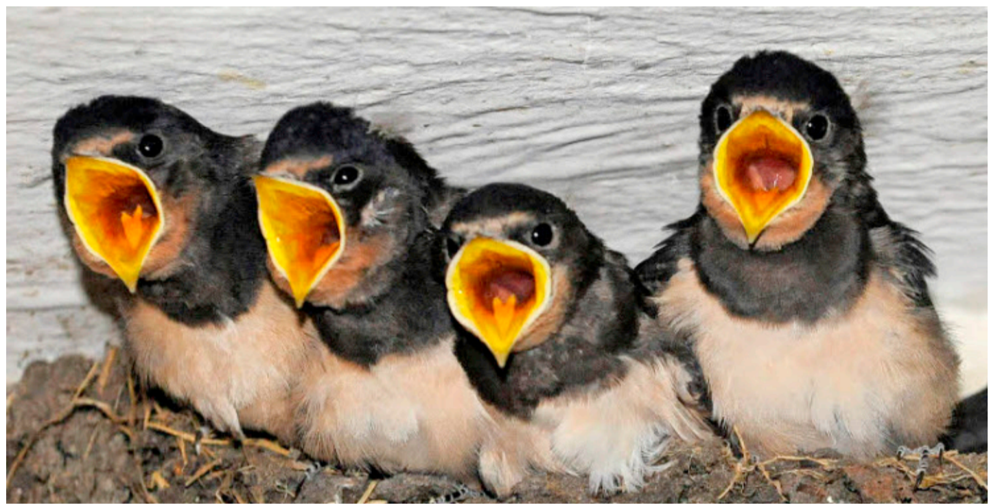
Das Futter und die Nistplätze werden knapp. Das bekommen auch die Mehlschwalben zu spüren.

Seit zwei bis drei Jahren ist der Rückgang der Vögel so signifi-